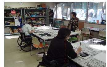
更生園のプログラム活動の様子 ここで制作した作品を展示しています！