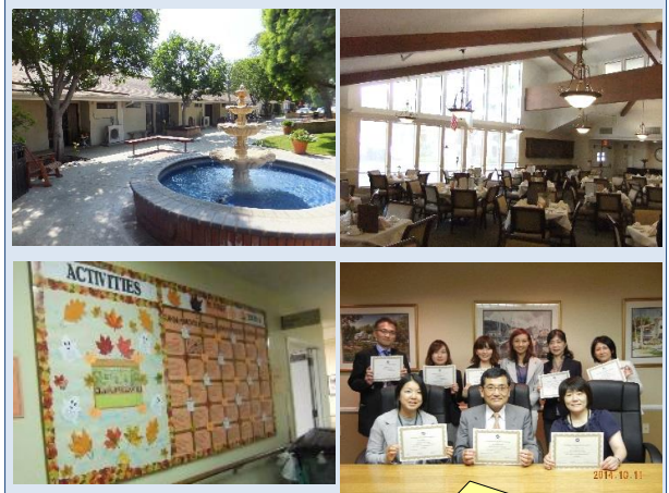
全てのプログラムを終えて、 修了証が授与されました！

創立100年の複合型高齢者施設で、日本の有料老人ホーム、療養型医療施設のような施設です。外来PTクリニックも併設され、教会、コーヒーショップ、グループ活動のコミュニティがあります。また、介護度の高い施設には認知症ユニットやホスピスもあります。