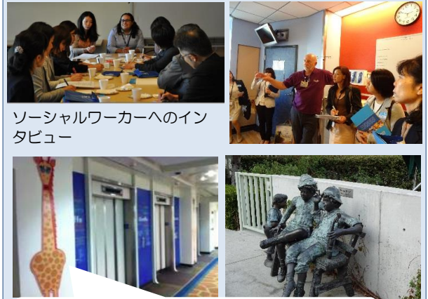
ソーシャルワーカーへのインタビュー