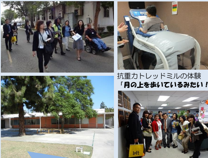
抗重カトレッドミルの体験 「月の上を歩いているみたい！」