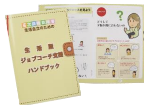
▲生活版 JC 支援ハンドブック